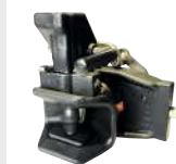
Axe 37mm sphérique