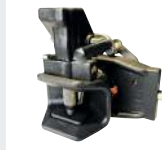
Axe 32mm cylindrique