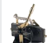
Axe 31mm cylindrique