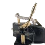
Axe 31mm cylindrique