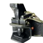
Axe 37mm sphérique