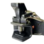
Axe 32mm cylindrique