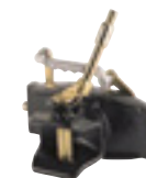
Axe 31mm cylindrique