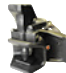
Axe 37mm sphérique