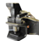
Axe 32mm cylindrique