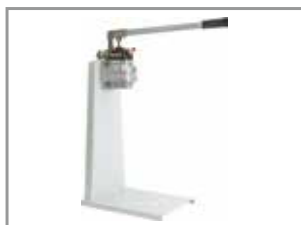
Pompe hydraulique à commande manuelle

On évite tout endommagement de la surface des profils coulissants