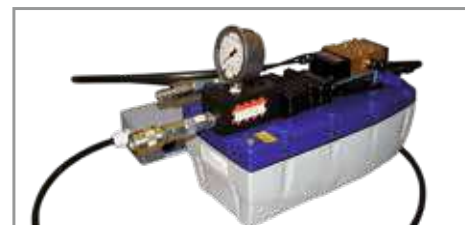
Groupe hydraulique à commande pneumatique