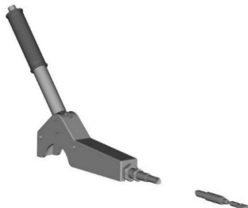
Figure 2: Câble Bowden avec levier